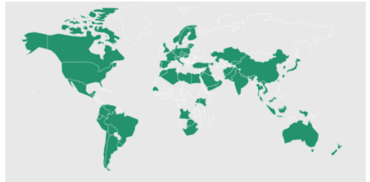
Figura 2 Indra en el mundo | Nota: tomado de Indra (s. f.)

Con mayor exposición mediática que los anteriores, destacó el grupo Indra, una de las empresas más relevantes a nivel planetario porque abarca rubros de comunicación, defensa y seguridad, con todo lo que ello puede significar. En su sitio web, la misma empresa ilustra su dominio planetario (en verde) con el siguiente mapa: