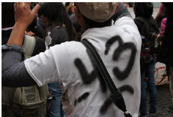
Fotografía 4. en manifestación por Ayotzinapa.

de una nueva política compensatoria que el Banco Mundial aplicó con el nombre de modernización. Ésta, desde luego, estuvo precedida de la disponibilidad mental y anímica de los gobiernos de erradicar otras concepciones prácticas significativas en la definición de estrategias de gasto y orientación de los programas educativos en nuestros países. Al descartar el objetivo de asegurar la universalidad de la educación, es decir, lo que la define como derecho social y responsabilidad del Estado (Sosa, 2007).