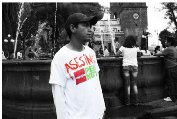
Fotografía 2. De propia autoría en manifestación por Ayotzinapa

policías municipales. El otro planteamiento, según el Grupo Interdisciplinario de Expertos Independientes (GIEI, 2015) fue la existencia de datos recopilados en el caso de Ayotzinapa, que refieren que el Gobierno Federal obtuvo información precisa de distintas fuentes para dar seguimiento a las acciones de los normalistas, con meses de anticipación, por lo que se tomaron “operaciones preventivas” para contrarrestar los riesgos previstos ante las inminentes acciones de los estudiantes normalistas, que tenían como objetivo primario llegar a la Ciudad de México, para conmemorar el asesinato de estudiantes el 2 de octubre de 1968, del entonces Distrito Federal.