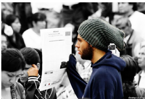
Fotografía 3. De propia autoría en manifestación por Ayotzinapa

manifiesto los problemas de impunidad y corrupción que afectan al país, pero que en realidad estas formas de violencia de Estado, conforman una tradición histórica de gobiernos en México, que han atentado contra su propia población y donde la clase estudiantil ha sido represaliada de manera constante, desde Tlatelolco hasta Ayotzinapa.