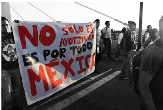
Fotografía 1. De propia autoría en manifestación por Ayotzinapa

asesinarlos. En esa versión también se “concluyó” que sus cuerpos habían sido incinerados en un basurero del Municipio de Cocula y, consecutivamente, sus cenizas arrojadas al Río San Juan, todo ello en el estado de Guerrero.